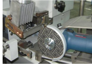
Corte gota Stellite mediante ángulo de afilado