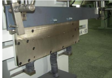
Motor asistencia para el movimiento vertical de la sierra.