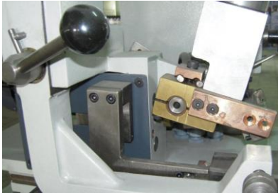
Estilizado manual y revenido automático.